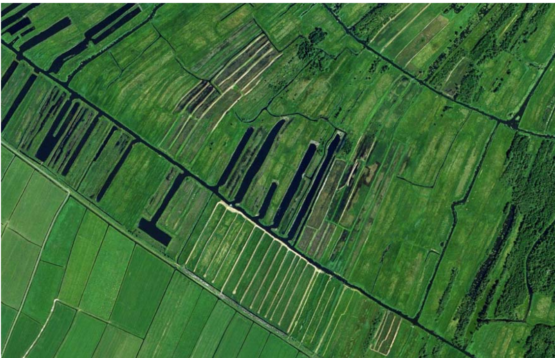
Het zomermaaien draagt bij aan de landschappelijke variatie en het creëren van 'zichtlijnen' in het landschap. Vanuit de lucht zijn de gemaaide ribben goed te zien

Ook is er een relatie tussen de landschappelijke en ecologische doelen van het zomermaaien: voor een optimale landschappelijke variatie (afwisseling tussen lage en hoge vegetatie, c.q. ribben en kraggen) is het belangrijk om de productievare ribben met een hoger opgaande begroeiing eerder te maaien dan de laagproductieve ribben met een schrale en dus lagere vegetatie. We komen hierop in § 3.3 nog terug.