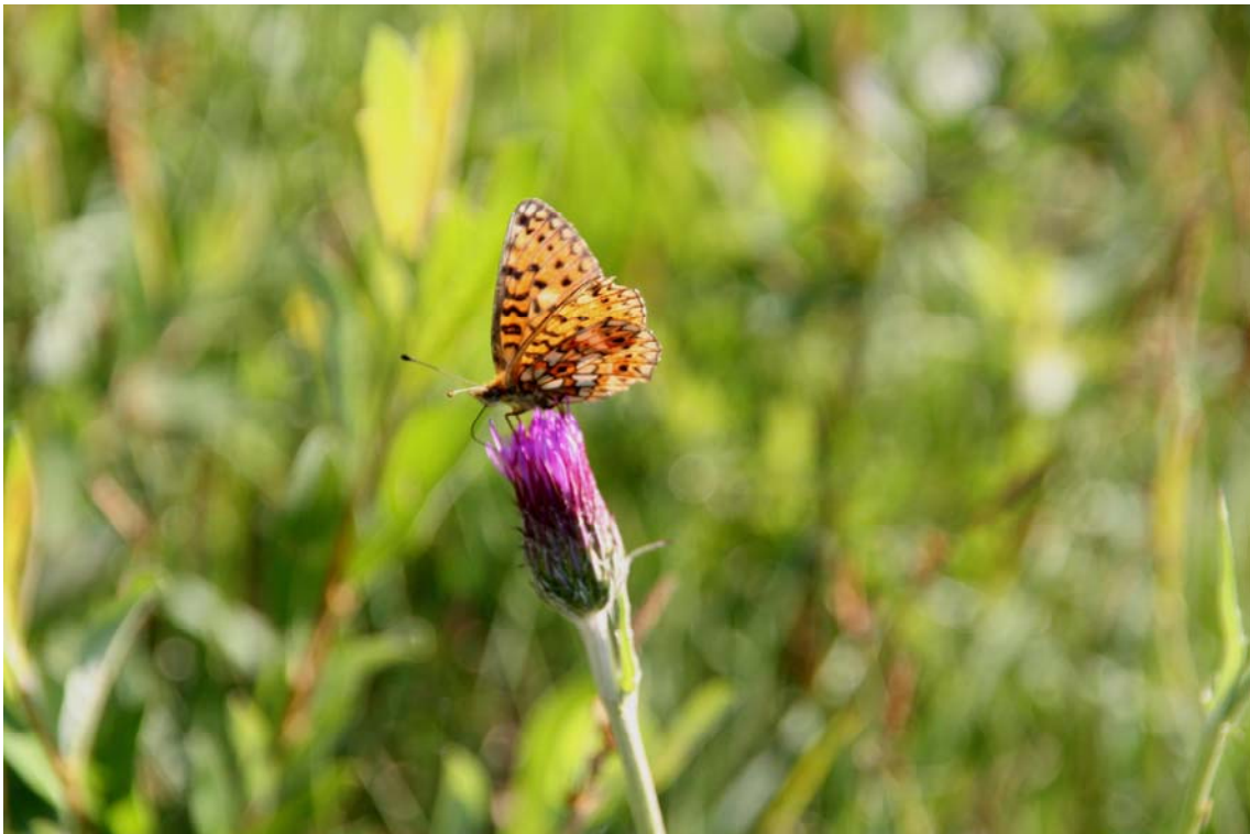
Spaanse ruiter, hier met zilveren maan, is een indicator voor ribben met goed ontwikkeld blauwgraslandkarakter

Uit de vegetatiekartering van Everts & De Vries uit 1997/98 blijkt dat er in de Weerribben toen 0,1 ha kwalitatief goed ontwikkeld blauwgrasland aanwezig was (type 1 uit de bovengenoemde classificatie) en 7,7 ha van de rompgemeenschap van blauwe zegge en blauwe knoop (type 2) (Tolman & Jongman 1999). Waarschijnlijk geven deze cijfers een onderschatting, omdat vooral brede ribben zijn gekarteerd. Ze geven wel een indicatie van de zeldzaamheid van het biotoop in de Weerribben.