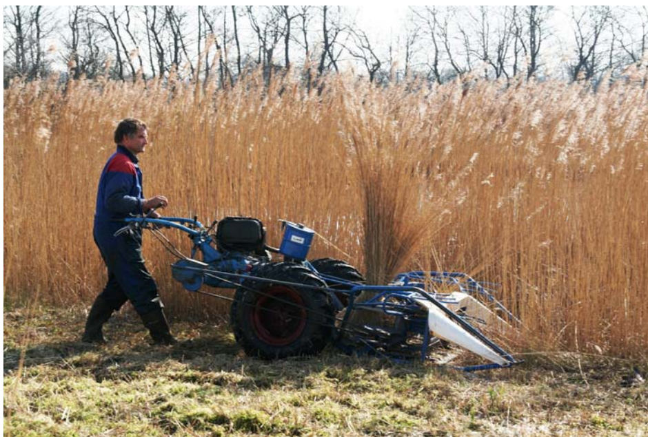
Rietteelt in de Weerribben: hoge arbeidsinzet, lage opbrengsten

Kijken we naar de vier bedrijven die in het onderzoek van bN+W vanuit de Weerribben meededen, dan hebben deze een gemiddeld inkomen van €412,- per ha per ha (€250,- excl. beheersubsidie) en €6,71 per uur. Dat is dus 15 à 25% onder het landelijk gemiddelde. Het is duidelijk dat de economische positie van de rietteelt heikel is. Aan rietteelt 'sec' is op dit moment bijna geen volwaardige boterham te verdienen. Dit blijkt ook uit het feit dat er bijna elk jaar wel enkele riettelers stoppen en hun land bij Staatsbosbeheer 'inleveren'.