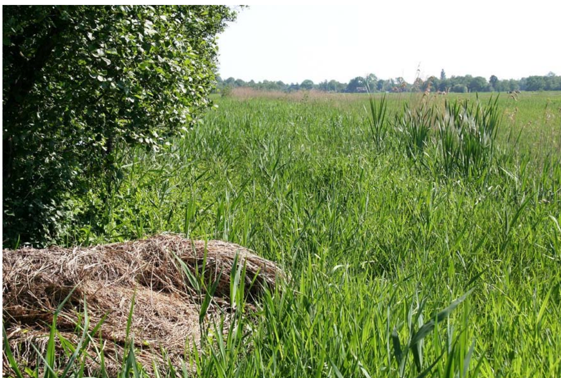
Voorbeeld van een verruigde (opgehoogde?) ribbe met veel rietgroei

Het zal duidelijk zijn dat jaarlijkse wisseling van gecontracteerde ribben niet bijdraagt aan optimale natuurresultaten, omdat zich telkens ‘continuïteitsbreuken’ voordoen. Eerste vereiste voor een doelmatig botanisch beheer is continuïteit. Daarnaast brengt wisselen controleproblemen met zich mee. Voor zover dit knelpunt zich nog voordoet, is dit regelingstechnisch eenvoudig te verhelpen (meerjarige contracten en/of vaste locatie vastleggen in werkovereenkomsten).