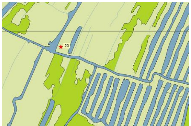
Situering van de opnamen in 2007.